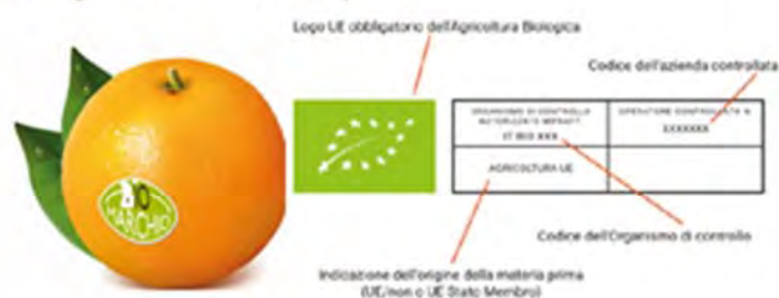
Fig 2. Etichetta, indicazioni: logo UE obbligatorio; codice OdC; codice Azienda; indicazione Origine.