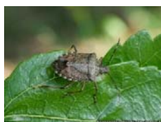
Azioni di contrasto ad Halyomorpha halys in Campania

(12) Deroga territoriale per l'utilizzo della s.a. Lambdacialotrina su Cachi , per il controllo della Mosca della frutta (Ceratitis capitata) Prot. 2024. 0422469 del 10/09/2024